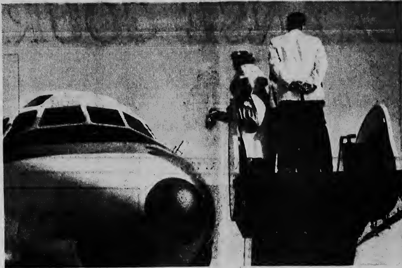
Venezuela. Y cu esei DC-8 a cerra amistad cu tur presentenan.

Principio dje programa di fiesta tabata caracteriza pa un fila di embrollonan tragi-comico cu tabatin pa consecuencia cu DC-8 a corre drechta puero aereo sin muziek, sin autoridanan. Na principio e ora di yegada tabata estipula riba 2'or; pero diripiente a ricibi noticia mainta cu tabatin dificultadnan tecnico abordo. Por bira hasta 5'or prome cu e aparato por drecha. E senjal aqui a ser corrigi despues y awor tabata sigur cu e prome avion-jet lo yega Corsow 3.30 di tramerdia. E ora aqui a ser transmiti pa radio. Masha hopi ehen hende no a tende nada di esaki y tabata para na Hato prome cu 2'or di tramerdia den tur e calor di solo na tranke ta spera yegada dje avion. Sin embargo tur e autoridanan si tabata avisa y tabata conta cu e avion lo yega 3.30. Y asina a socede cu hopi autoridat tabata sinta tranquil na cas ora cu diripiente e grito di Hato a resona: "Jet ta bini!" Y eberdad: ata e pajaro gantesco tabata bini, bulando te abao y no a dura mucho cu su wiclan a toca cu e beton. Tabata